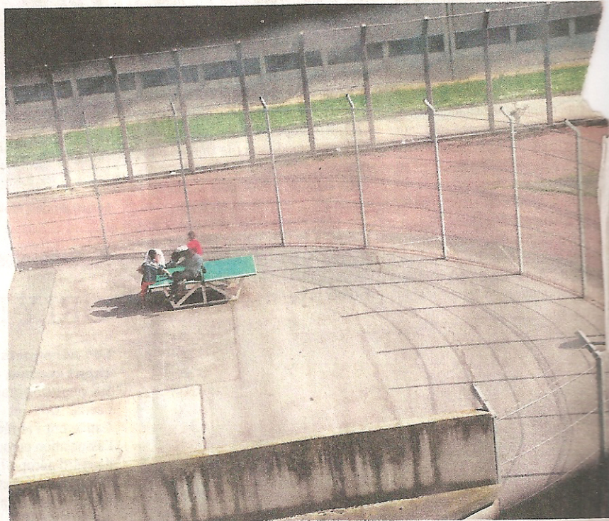
La cour de promenade du quartier des mineurs de la prison de Fleury-Mérogis.

S'ils envisagent de s'engager dans une campagne de sensibilisation à l'échelle nationale, les producteurs destinent en priorité leur travail aux jeunes des quartiers populaires. «Pour la diffusion, on fait appel aux associations de quar-